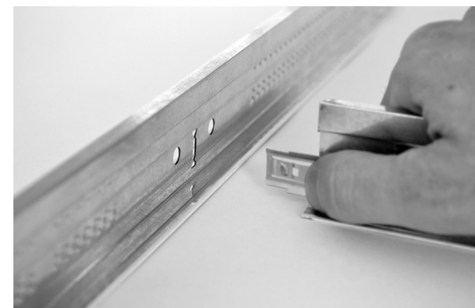
Demontage durch leichten Daumendruck auf den Edelstahl-Clip