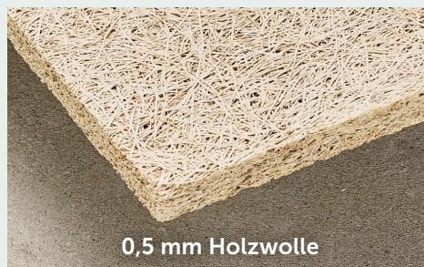
0,5 mm Holzwolle